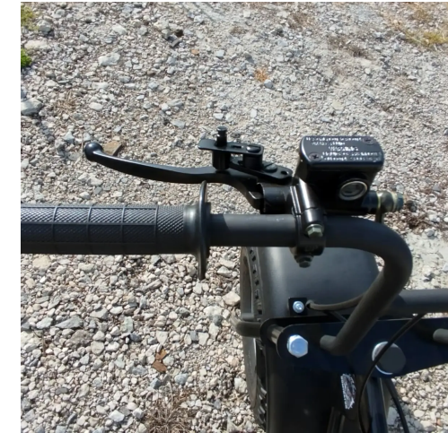
Рукоятка дроссельной заслонки. Рычаг тормоза. Кнопка стояночного тормоза.