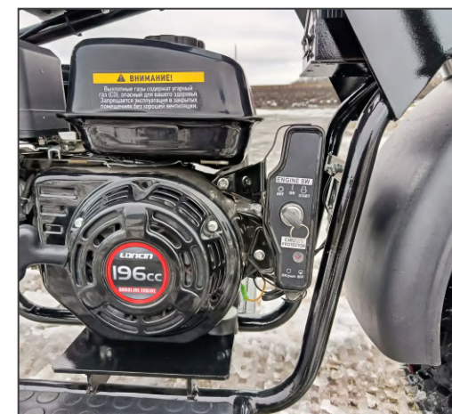
Замок зажигания модель Dominator Pro / Pro Max. OFF/ON/START.