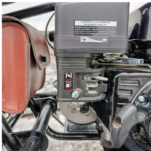
Положение рычагов карбюратора после запуска двигателя.