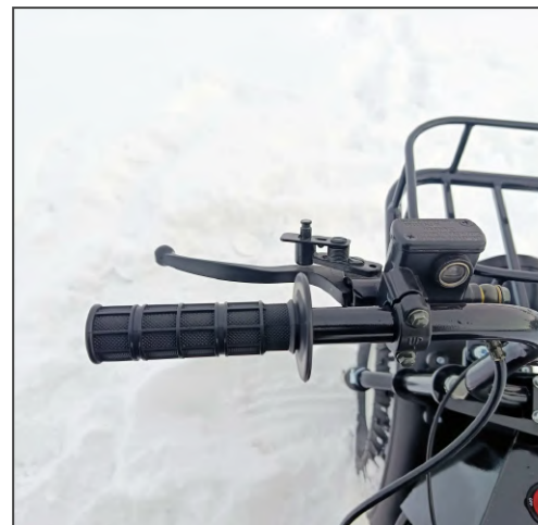
Рычаг тормоза. Кнопка стояночного тормоза.