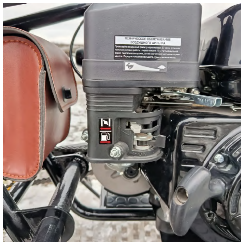
Положение рычагов карбюратора перед запуском двигателя.