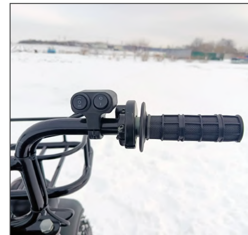
Рукоятка дроссельной заслонки. Переключатели света (для модели Dominator Pro / Pro Max).