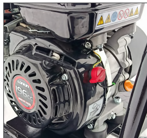
Выключатель зажигания модель Dominator. OFF/ON